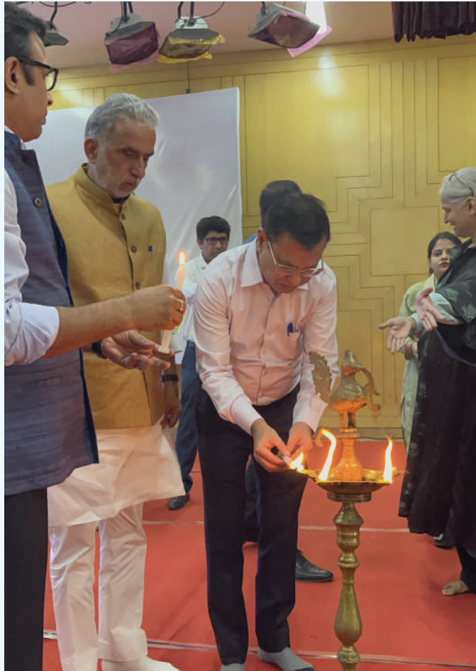
फिलपकार्ट और पॉलिसे वाच इंडिया फाउंडेशन द्वारा फरीदाबाद में आयोजित कार्यशाला का उद्घाटन करते केंद्रीय सहकारिता राज्य मंत्री कृष्ण पाल गूजर एवं अन्य।