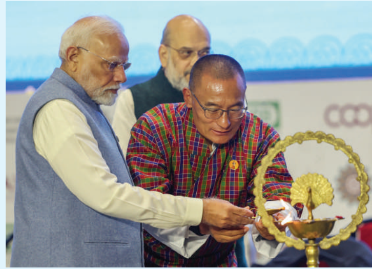
युवा सहकार टीम

असमानता कम करने, बेहतर कल्याणकारी उपायों को बढ़ावा देने और गरीबी उन्मूलन में इन समितियों की भूमिका है निर्णायक