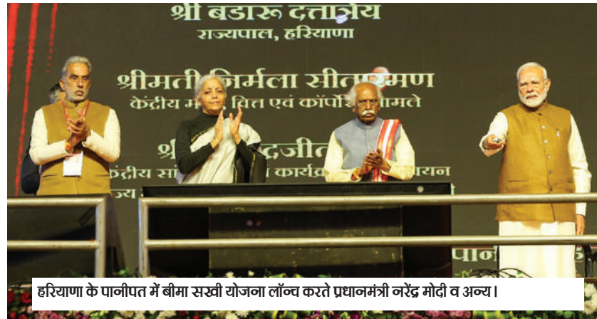
हरियाणा के पानीपत में बीमा सखी योजना लॉन्च करते प्रधानमंत्री नरेंद्र मोदी व अन्य।

हरियाणा में लागू होगी और धीरे-धीरे पूरे देश में इसे शुरू किया जाएगा। इन महिलाओं को 3 साल की ट्रेनिंग करनी होगी। ये ट्रेनिंग सरकार की ओर से करवाई जाएगी। ट्रेनिंग के बाद एक परीक्षा पास कर महिलाएं विकास अधिकारी भी बन सकती हैं।