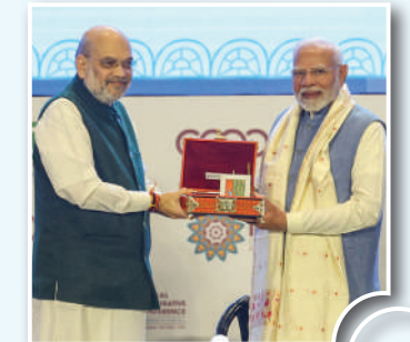
सहकारिता भरेगी नई उड़ान