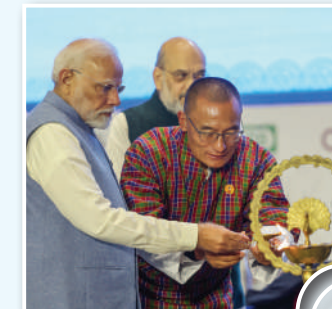
दुनिया ने सुनी भारतीय सहकारिता की धमक