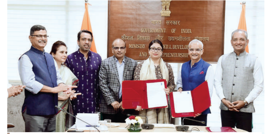
केंद्रीय कौशल विकास राज्य मंत्री (स्वतंत्र प्रभार) जयंत चौधरी की मौजूदगी में मेटा से हुआ एमओयू।

इस साझेदारी के तहत मेटा के ओपन सोर्स लामा मॉडल द्वारा संचालित एक एआई-चैटबॉट विकसित किया जाएगा, जो स्किल इंडिया डिजिटल (एसआईडी) पोर्टल पर शिक्षार्थियों के अनुभव को बढ़ाएगा। एसआईडी पोर्टल में एकीकृत किया जाने वाला चैटबॉट उपयोगकर्ताओं को 24 घंटे सहायता प्रदान करता है। इससे पाठ्यक्रम की जानकारी की खोज, पाठ्यक्रम सामग्री के लिए इंटरैक्टिव प्रश्नोत्तर और संशोधन के लिए व्याख्यान